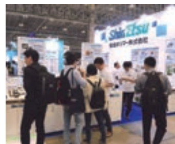
【第12回プラスチックジャパン】 出展の様子