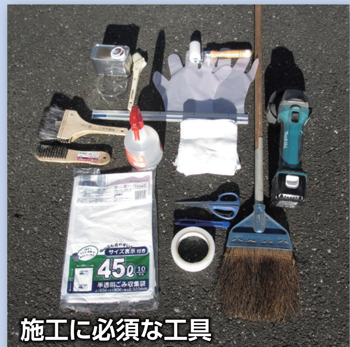
施工に必要な工具