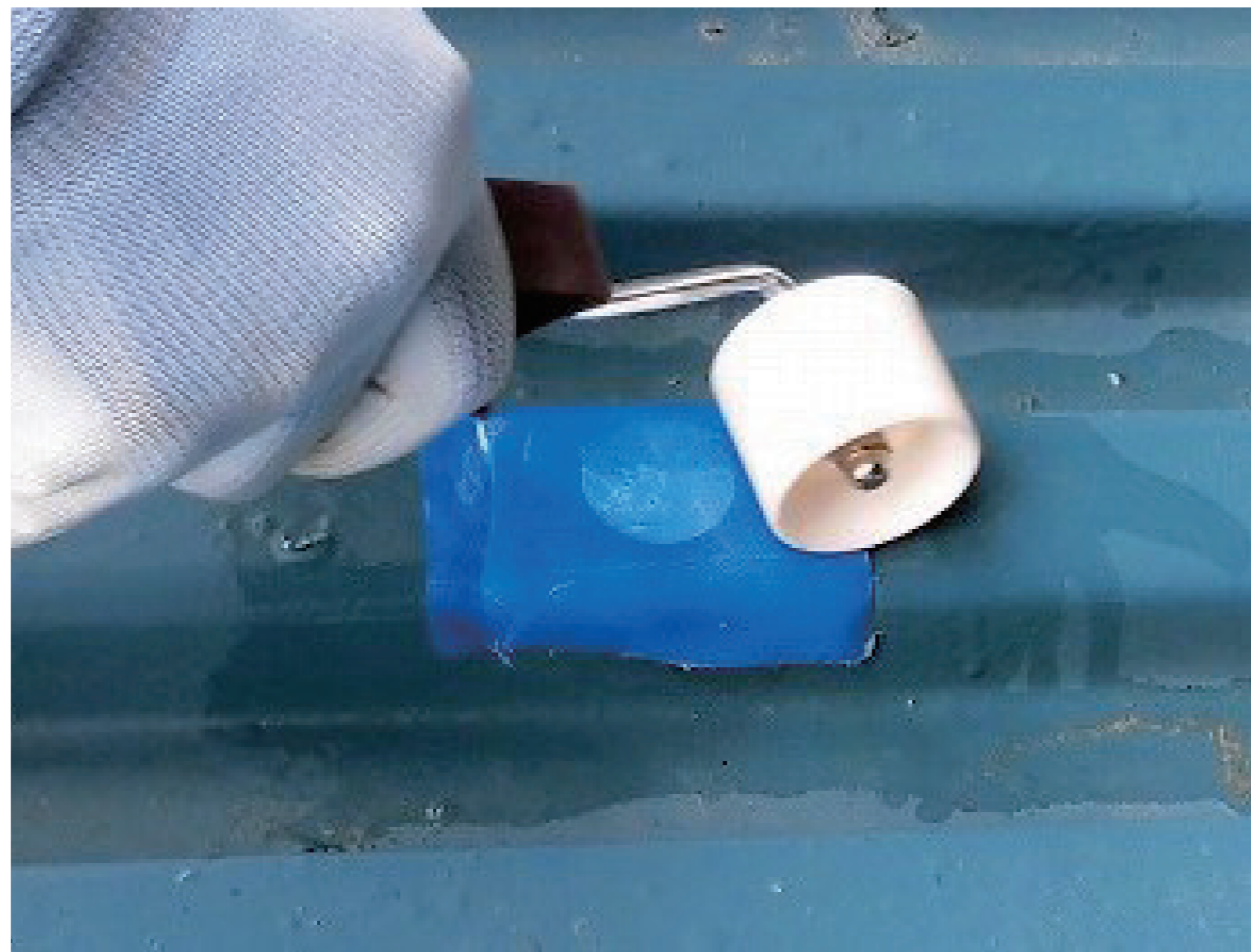
折半屋根の漏水補修が可能