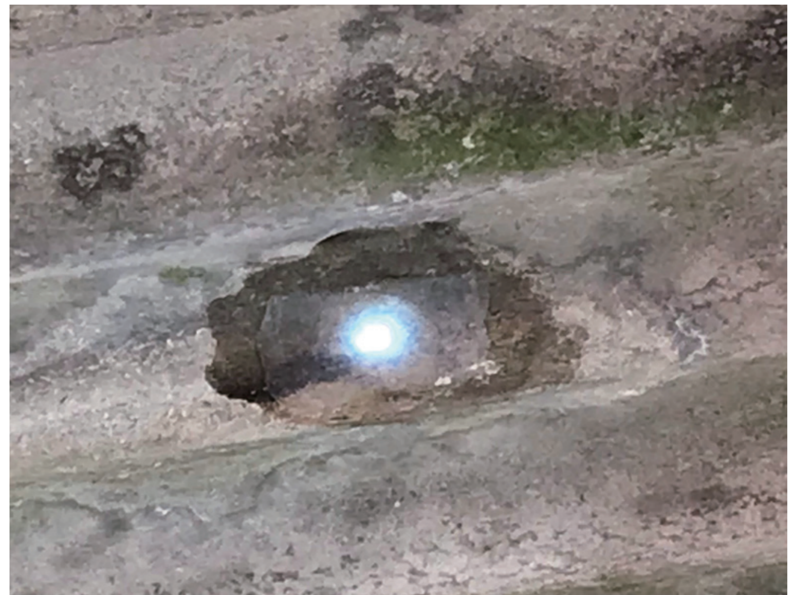
屋内側からスレート波板の漏水補修が可能