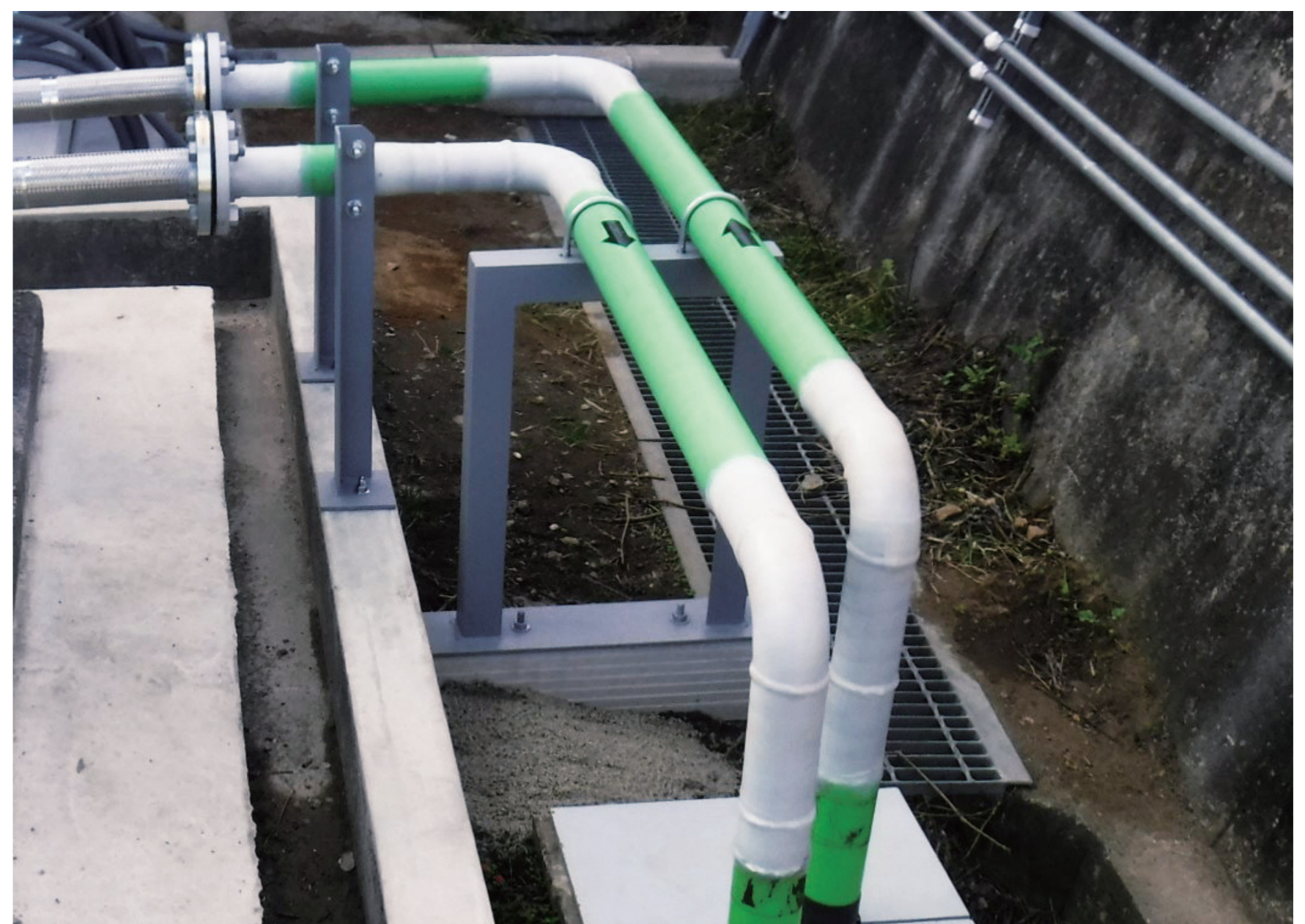
現場溶接部に巻き付けるだけで、サビ予防が可能