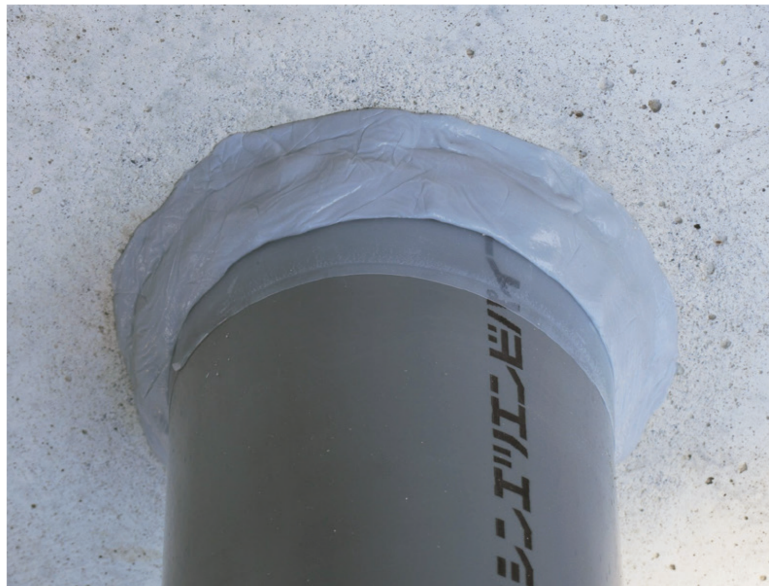
コンクリート貫通孔漏水補修が可能