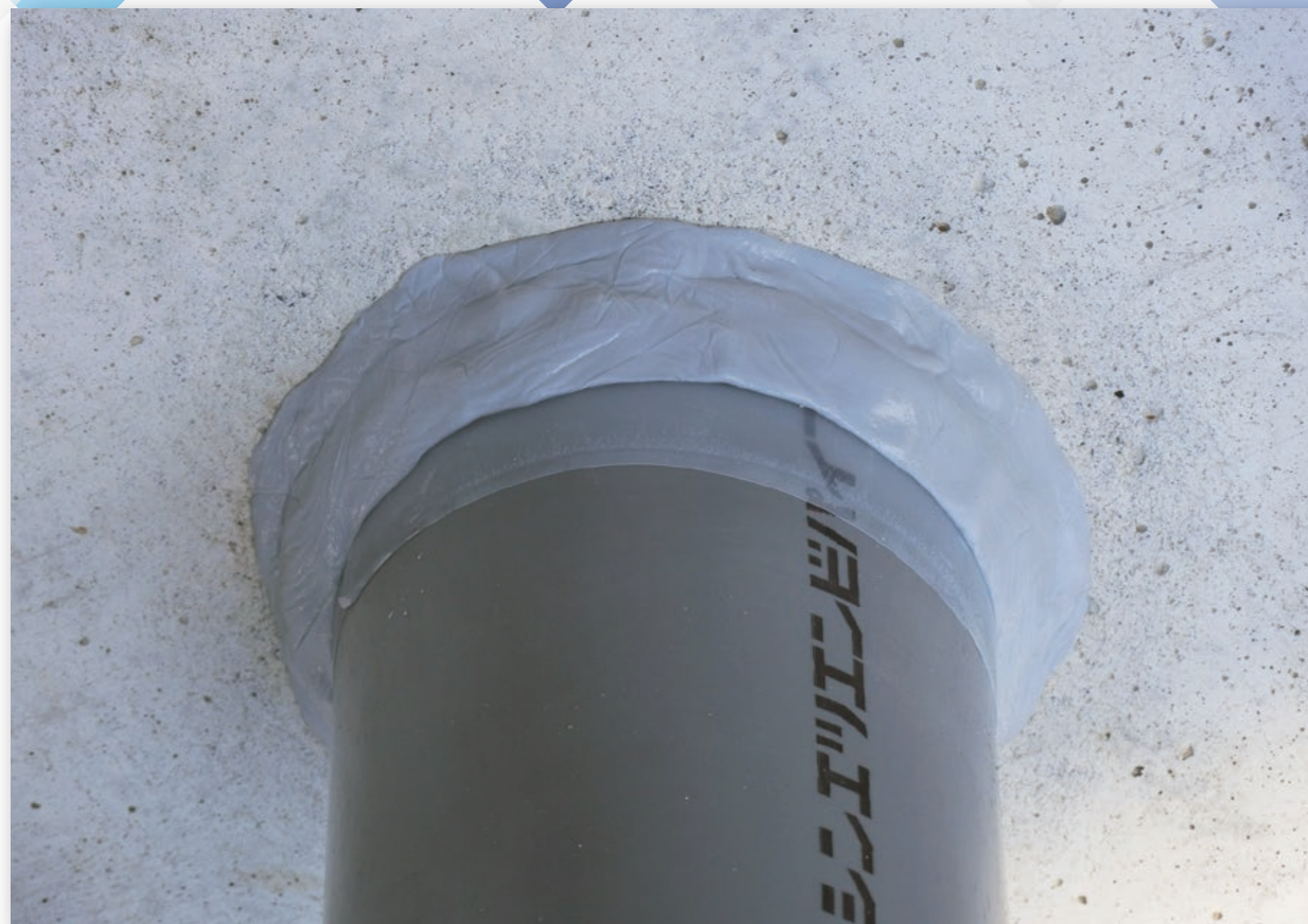
コンクリート貫通孔漏水補修が可能