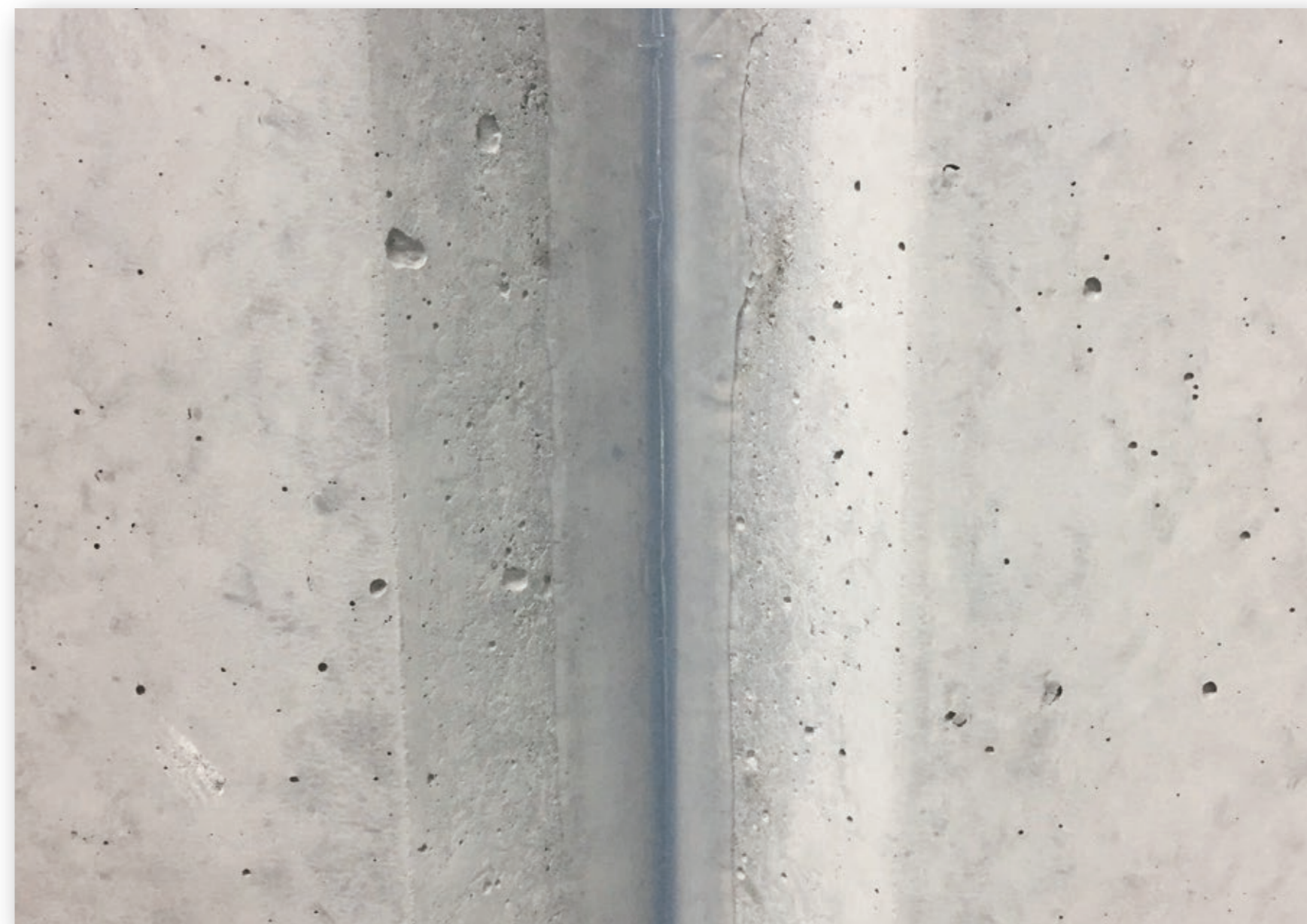
絶縁目地の漏水補修が外部から可能