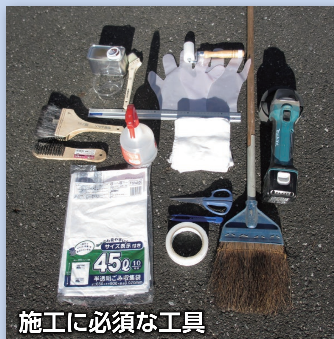
施工に必要な工具