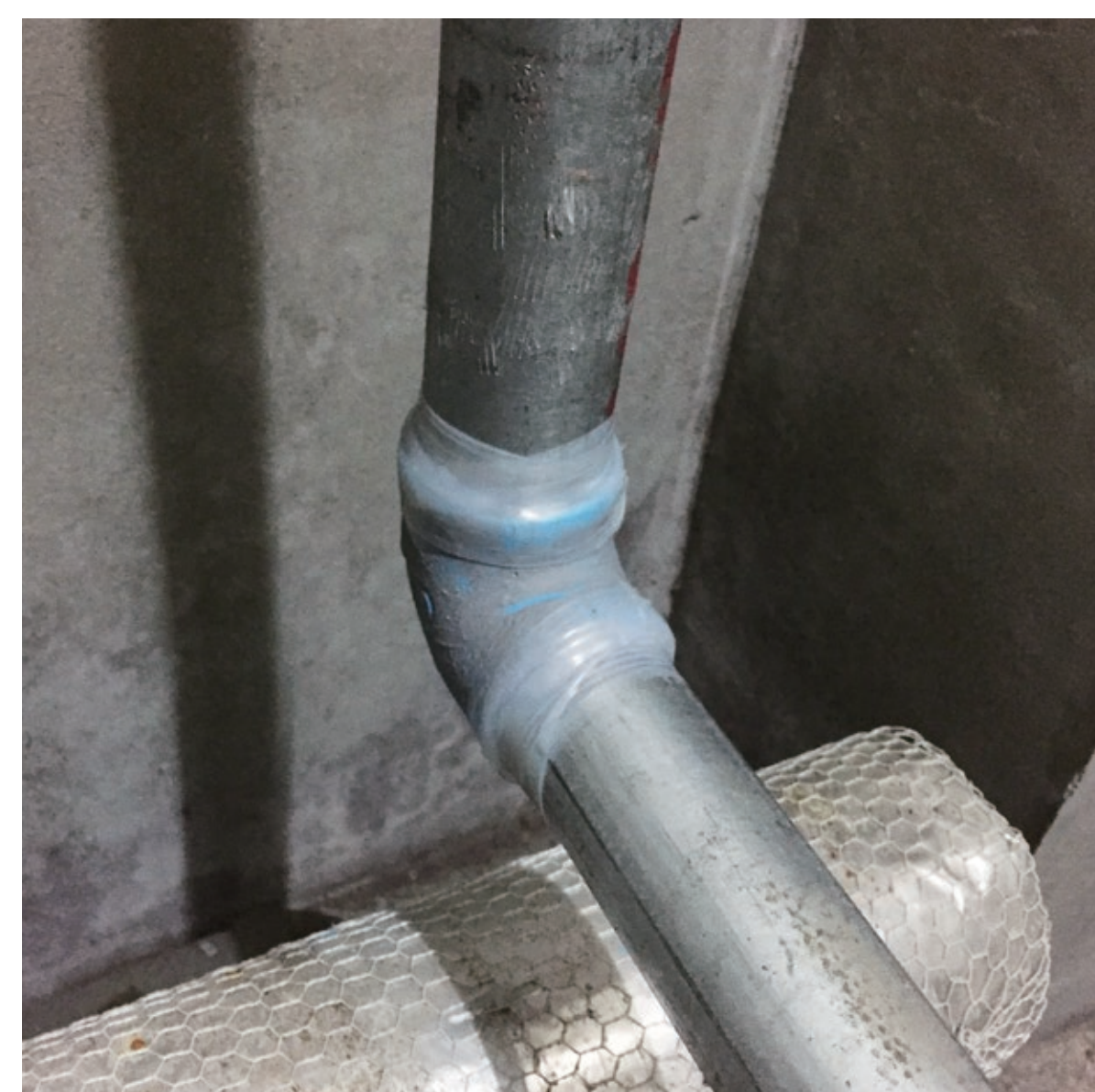
自在に伸びるテープなので、R部分にも密着