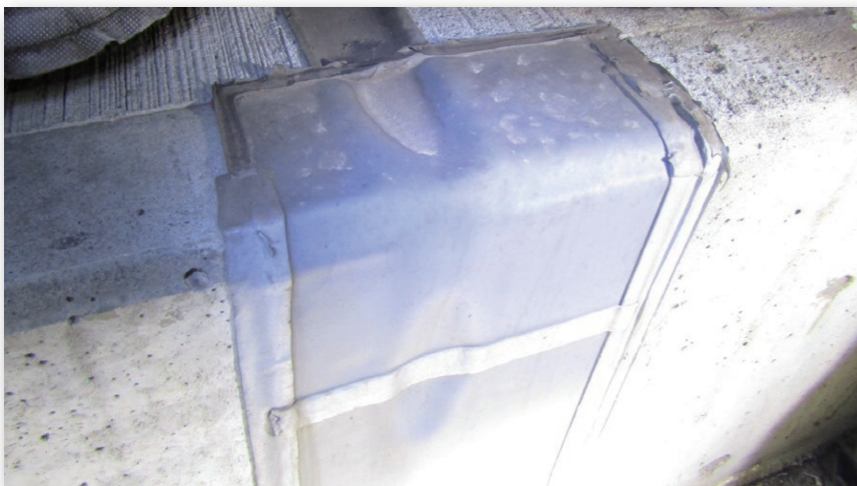
夜間の短時間で遊間目地防水が可能