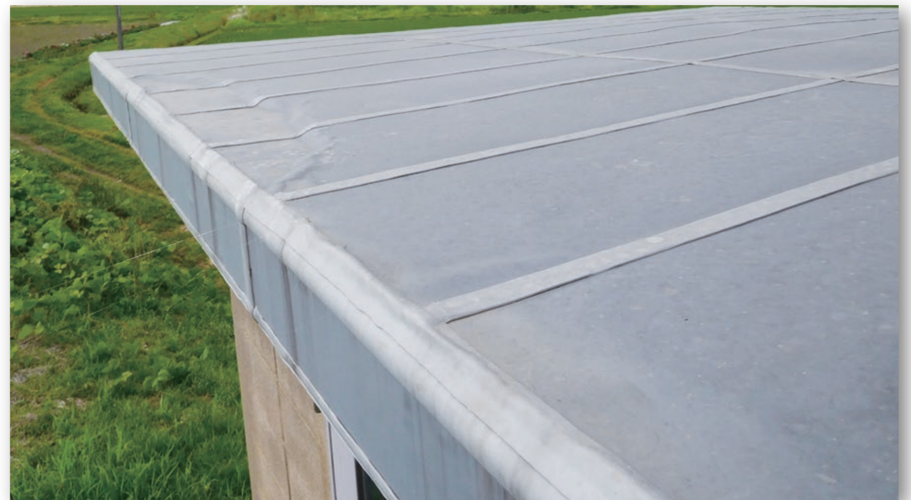
シートを連続貼りし、接続部をポリマエースPAで一体化