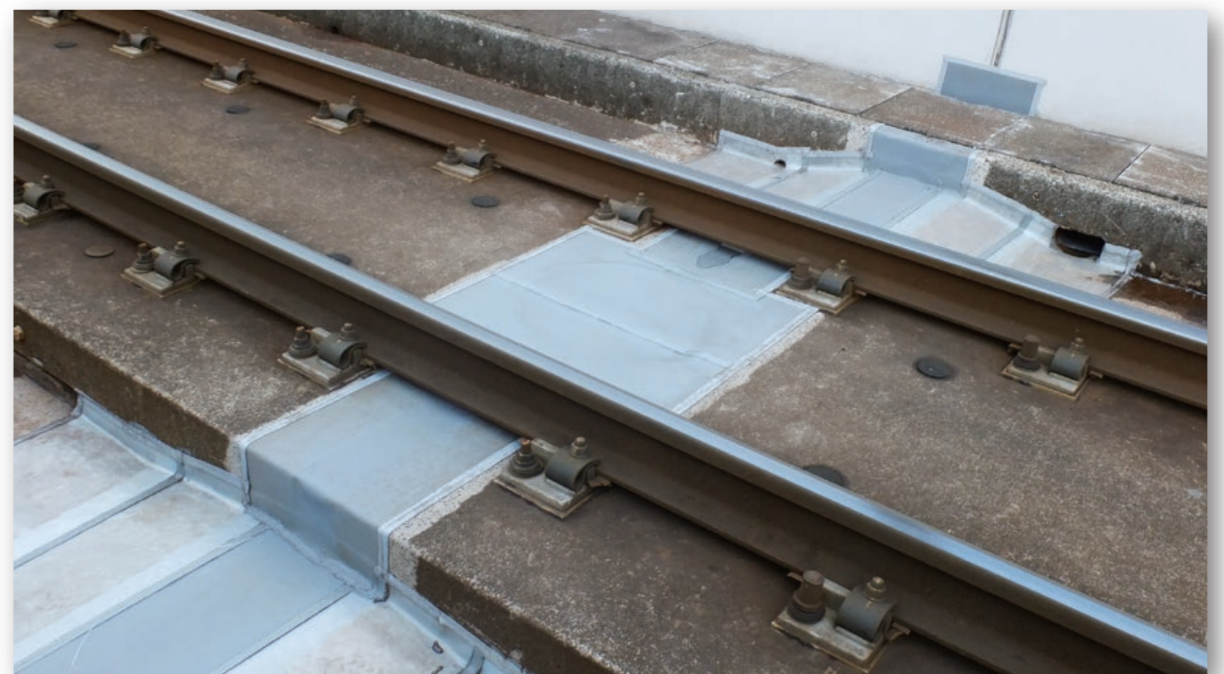
遊間部の底面への施工も短時間で可能