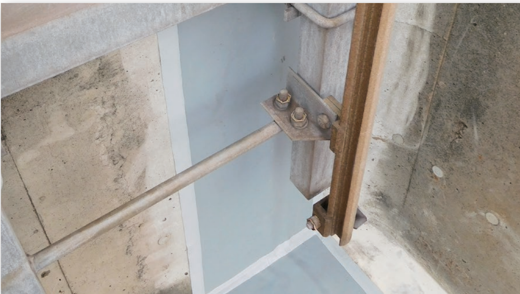
施工箇所の形状が複雑でも現地で製品の加工が可能