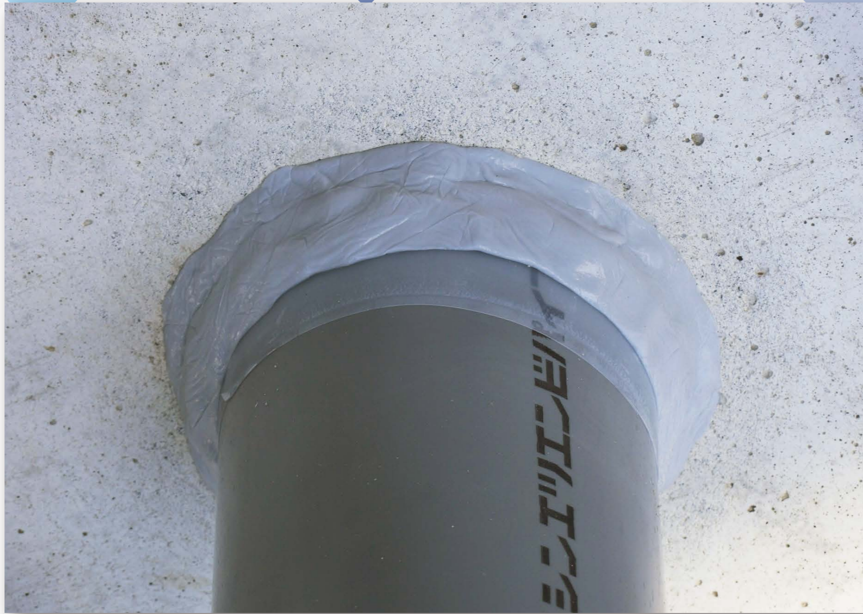
コンクリート貫通孔漏水補修が可能