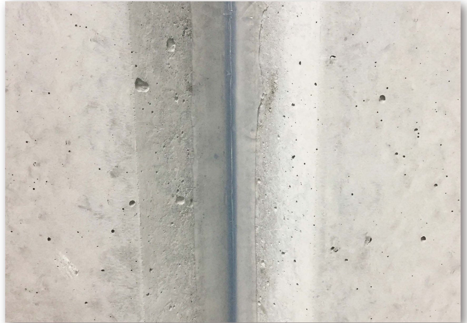
絶縁目地の漏水補修が外部から可能