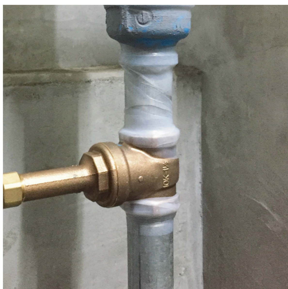
配管ジョイントからの水漏れや、さび防止が可能