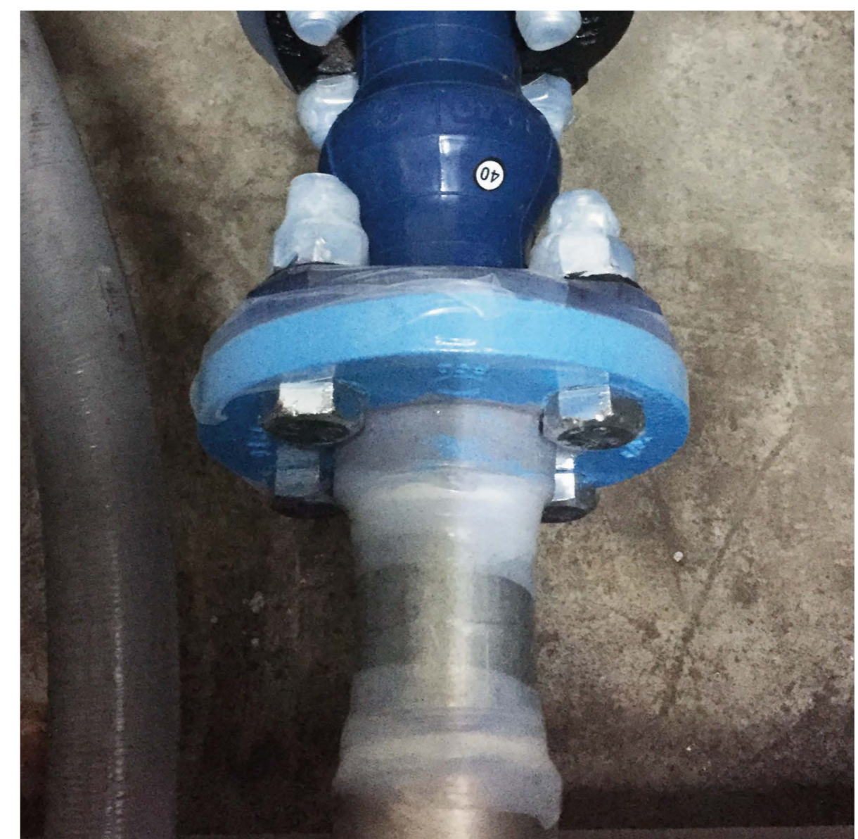
フランジやボルトに巻き付けるだけで、さび止めが可能